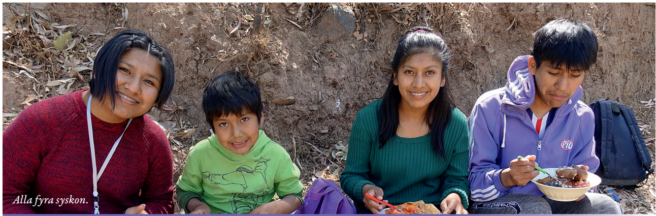
Alla fyra syskon.