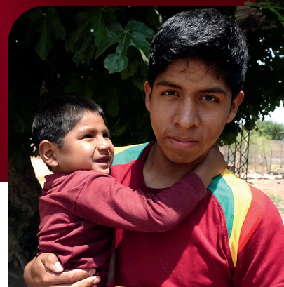
Alla bilder tagna i Bolivia publicerade i detta nyhetsbrev är tagna av personalen på Barnens räddningsarks barnhem.